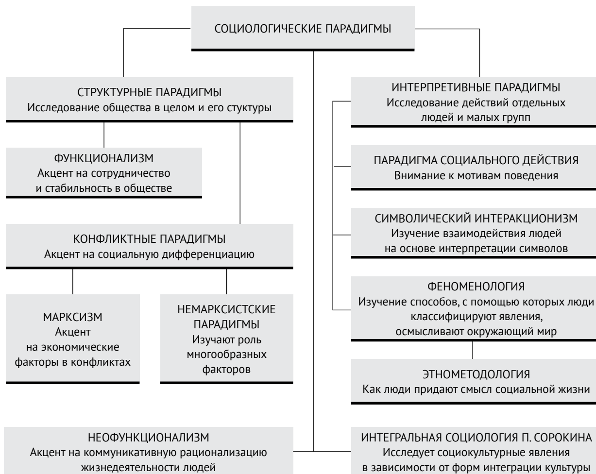
Рисунок 2. Состав основных социологических парадигм