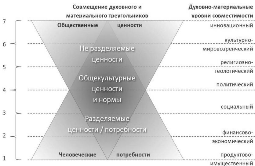
Рис. 1. Совместимость ценностей и потребностей человека и общества

Выделяют абсолютные (вечные) ценности и ситуативные (переходящие) ценности и ценностные ориентации (эмпирические переменные). В связи с чем ценности различают по выполняемым функциям как: способ ориентации; средство контроля в социальных группах; функционально необходимые нормы при формировании социального продукта. Представим графически на рис. 1 распределение разного рода ценностей в наложении на человеческие потребности по уровням совместимости подсистем общества [4].