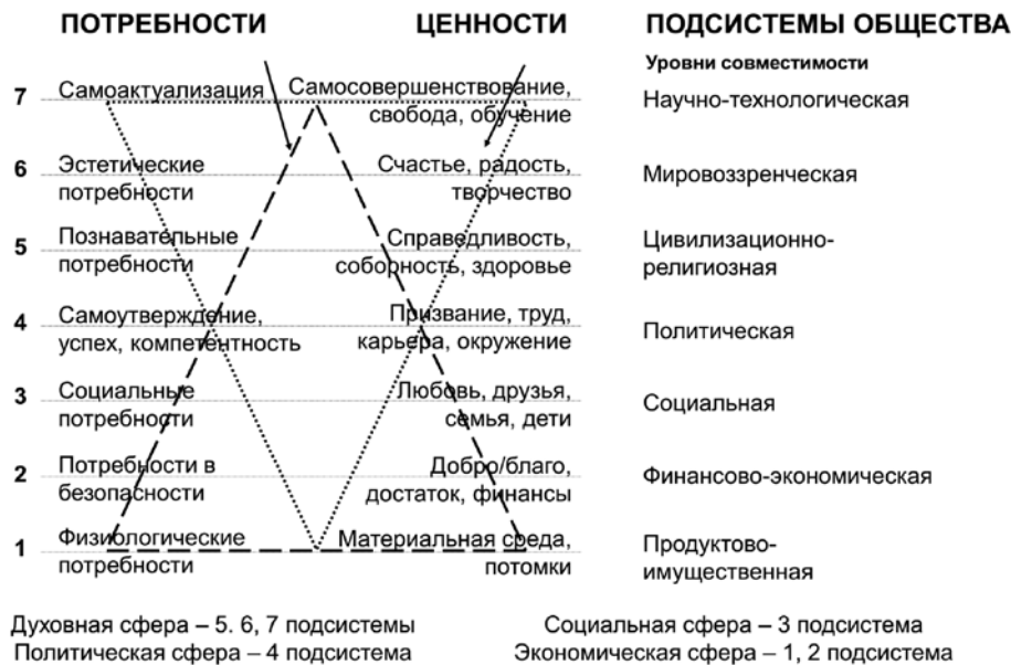
Рисунок 1. Совместимость ценностей и потребностей человека и общества

го. Исследуя эту структуру (пирамиду из семи уровней), автор также позволяет ассоциировать в нижней пирамиде число уровней потребностей с числом энергетических уровней человека (его тонкого тела), согласно биоэнергетической медицине [8]. Как совместить человеческие потребности и общественные ценности, позволяющие каждому человеку рассматривать себя органической частью единого духовно-материального пространства общества? Используя названные выше основные принципы философии единого поля, наложим человеческие потребности (нижняя часть ромба) на систему ценностей (верхняя часть ромба) (рис. 1).