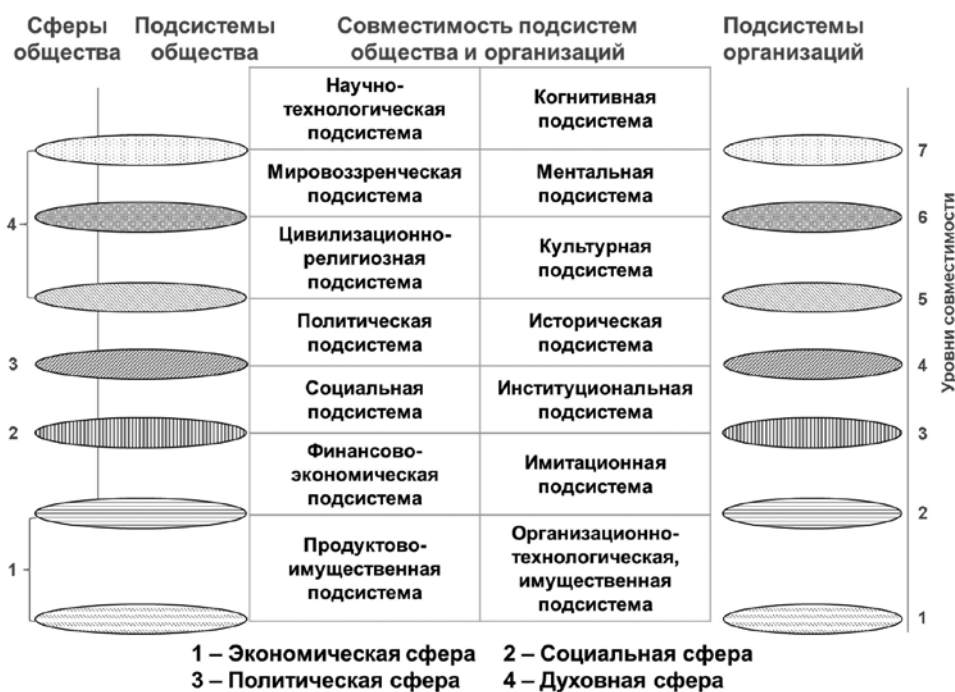
Рисунок 2. Совместимость подсистем/сфер общества и организаций

рии совместимости компонентов общества, заложив в его структурную модель принцип совместимо-непрерывного обновления («принцип фонтана»), который был формализован в виде матрицы 7 \times 7 . Предложенный понятийно-категориальный и образный аппарат позволяет представить общество в виде семи взаимодействующих уровней с описанием разнообразия процессов. Представленные на рис. 1 уровни совместимости характеризуются параметрами, непосредственно связанными между собой. Для изучения и решения данной задачи наиболее важным моментом являются режимы равновесия. Первый — режим периодического (или квазипериодического) внутреннего движения ресурсов, который является режимом генерации колебаний. Второй — «солитонный» (солитон — тип волн на поверхности воды) режим, при котором образуется длительное незамирающее движение ресурсов, соответствующее эволюционному развитию системы. Включение и пульсирование системы с обновлением жизнедеятельности его подсистем можно представить в виде обобщенной функции Хевисайда [9, с. 247], что позволяет в совокупности рассматривать (рис. 3) происходящие процессы: (Г) гармонизации (в том числе морфологические) совмести-